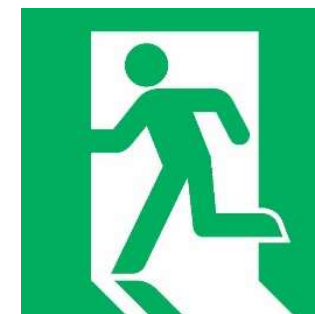
非常口のマーク (世界共通デザイン)