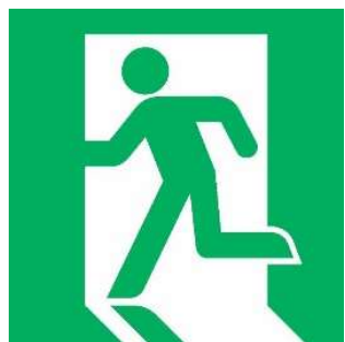
非常口のマーク (世界共通デザイン)

ISO規格の例としては、非常口のマークやカメラの感度、ネジ、チャイルドシートの規格など、工業製品だけでなく、品質管理や環境管理のマネジメントシステムの標準も決められている。