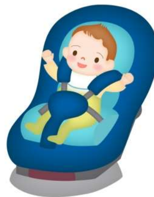
チャイルドシート (世界共通取り付け方法)